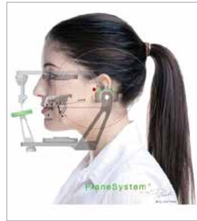
... mit Plane System erfasst