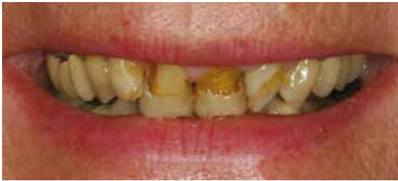
Gestörte dentale Ästhetik ...