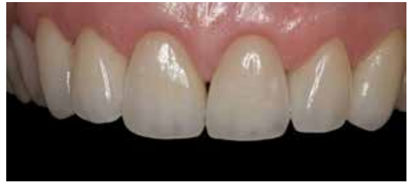
... minimal-invasiv versorgt