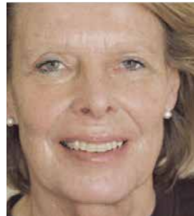
Dentale Unterstützung der Gesichtsästhetik